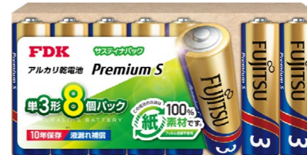
Premium S サスティナパック®アルカリ乾電池単3形

かった100%紙素材で包装した「サスティナパック」を製品ラインアップに追加いたしました。