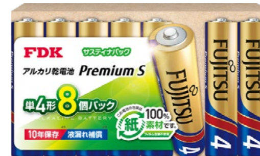
Premium S サスティナパック®アルカリ乾電池単4形