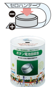
ボタン電池回収缶

お問い合わせ先：ボタン電池回収推進センター http://www.botankaishu.jp