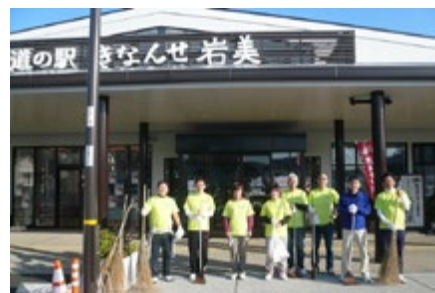
道の駅での清掃活動 (鳥取工場)