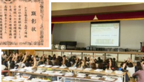
群馬県環境賞環境功績賞受賞(高崎工場)