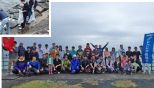
浜名湖クリーン作戦への参加