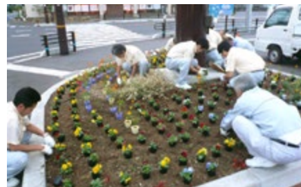
花壇の手入れ活動 (鳥取工場)