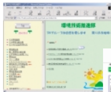
FDK環境ホームページ

廈門FDKでは、独自のホームページの開設と合わせて、毎月1回環境新聞を発行して環境活動の様子を全員に公開しています。