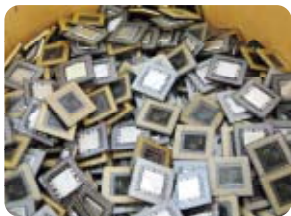
解体・分別されたIC