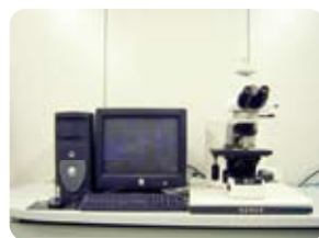
アスベスト測定用位相差分散顕微鏡