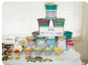
再資源化(貴金属等)