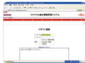
リサイクル統合情報管理システム

富士通りサイクル統合情報管理システムの導入により、適正な廃棄物管理をオンラインで行い、徹底したトレーサビリティとセキュリティの確保に努めるべく、2007年度からテスト運用を開始しました。