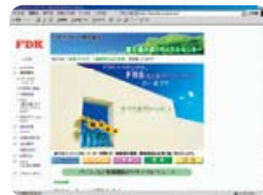
当社のホームページ

2007年8月に当社のHPを開設しました。当社の事業内容および資源循環型社会の実現に向けた取り組みを紹介するとともに、各種お問い合わせに対応できるようにしています。