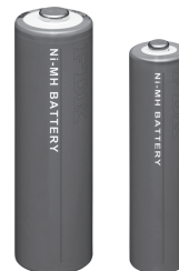
ニッケル水素電池「HR-3UTG」(左) ニッケル水素電池「HR-4UTG」(右)