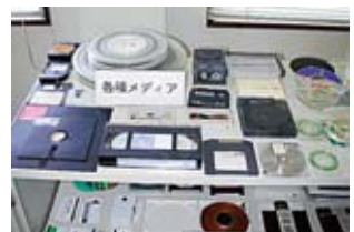
データ消去対応メディア