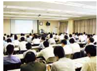
お取引先への説明会(湖西工場にて)

2005年度は前年度に引き続きグリーン調達説明会を開催して、お取引先へFDKグループのグリーン調達の考え方と進め方をご説明し、ご協力いただくようお願いしました。そして、88社において新規に環境マネジメントシステムを構築していただきました。そのうちFDKEMSをご構築いただいたのは、2社です。今後も、お取引先においてマネジメントシステムの新規構築をお願いし、FDKEMS構築の支援を進めていきます。